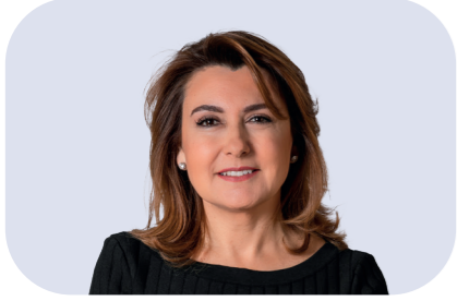
Arzuhan Doğan Yalçındağ Vakıf Başkanı