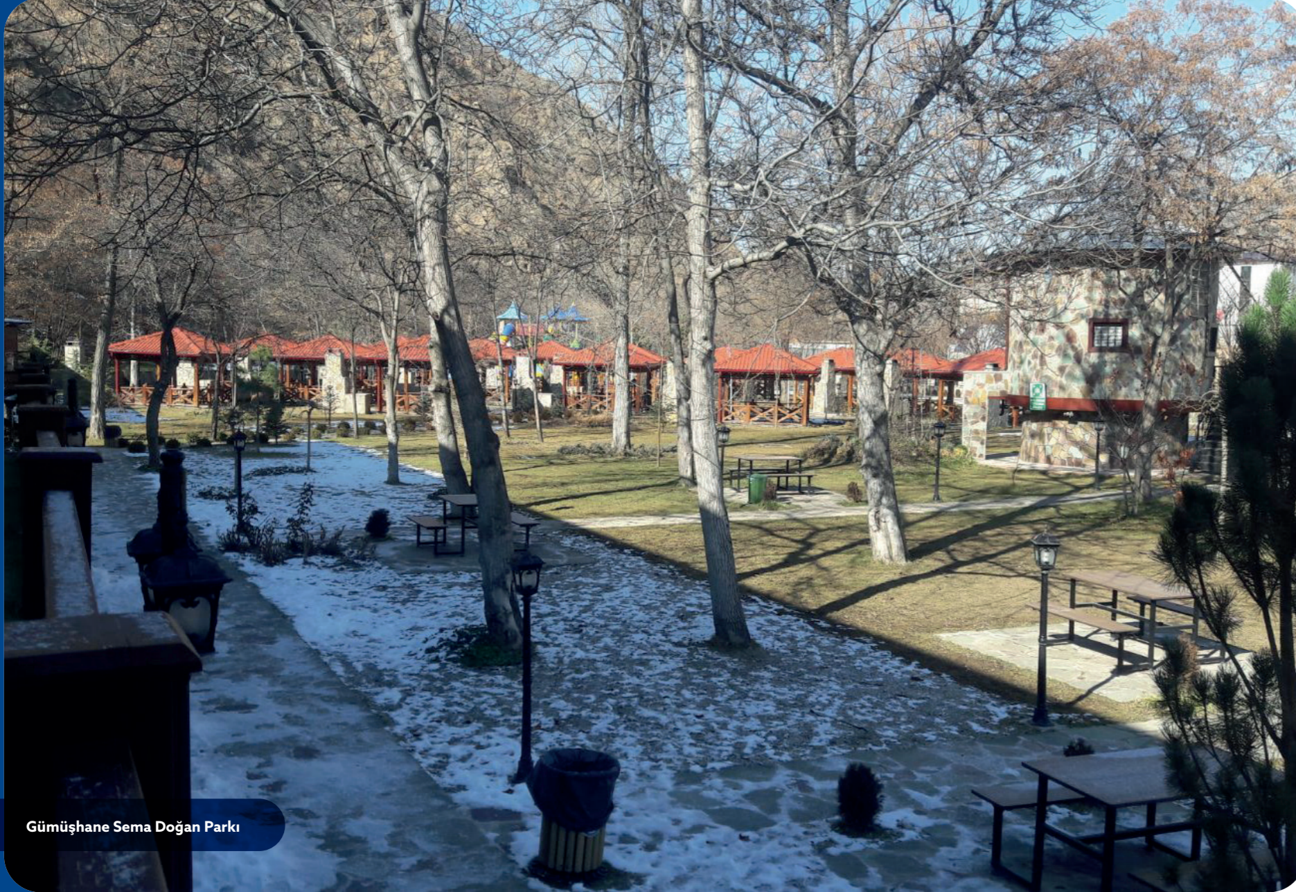
Gümüşhane Sema Doğan Parkı